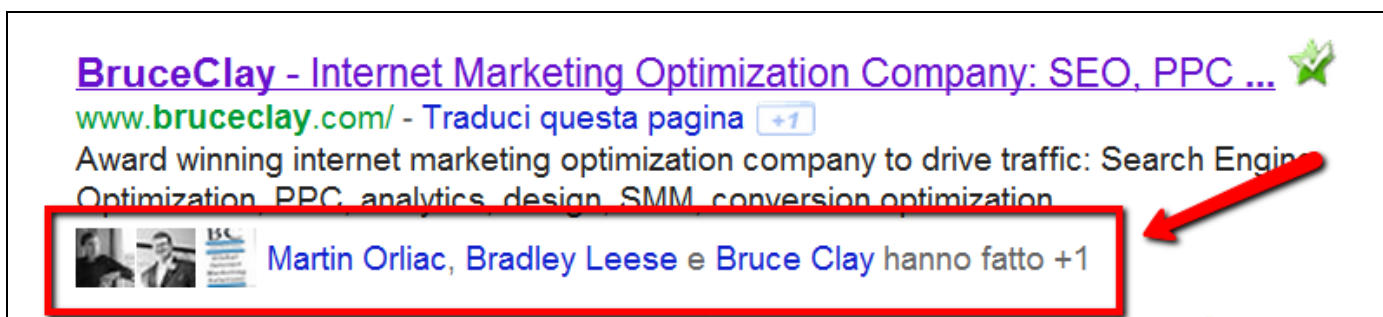
Immagine 3: visualizzazione pulsante Google + nella SERP di Google con indicazione di conoscenti che hanno fatto + 1

Nel caso in cui un utente Gmail con cui abbiate una relazione tracciabile da Google (ad esempio vi siete scambiati un email) abbia fatto +1, allora potrebbe accadere che cercando su Google, potreste visualizzare nei risultati una evidenziazione con il messaggio "Gli utenti Pippo e Caio hanno fatto +1" ( Immagine 3).