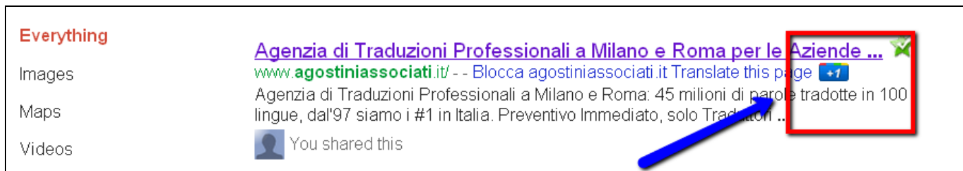
Immagine 2: visualizzazione pulsante Google + dopo essere stato cliccato da utenti loggati

Nel caso in cui un utente Gmail con cui abbiate una relazione tracciabile da Google (ad esempio vi siete scambiati un email) abbia fatto +1, allora potrebbe accadere che cercando su Google, potreste visualizzare nei risultati una evidenziazione con il messaggio "Gli utenti Pippo e Caio hanno fatto +1" ( Immagine 3).